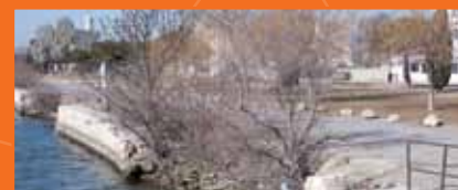
☞ Digue de Port-Saint-Louis-du-Rhône