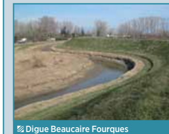
Digue Beaucaire Fourques