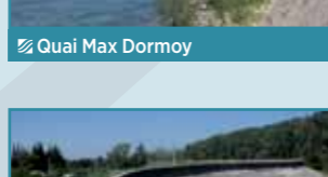
Digue de la Montagnette