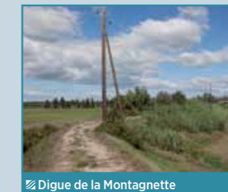
Digue de la Montagnette