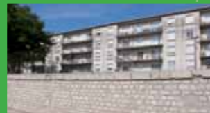
Digue de la Vierge à Beaucaire