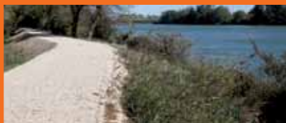
☞ Digue du Petit-Rhône

➤ Côté littoral, le SYMADREM va engager dans les prochains mois une étude pour la sécurisation de la digue à la Mer à l'Est des Saintes-Maries-de-la-Mer, point de faiblesse du dispositif de protection contre les submersions marines. ☞