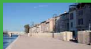
Quai de la Roquette