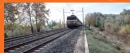
☞ Voie ferrée Tarascon-Arles