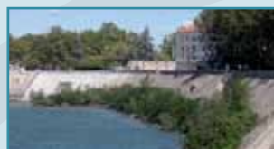
Quai Max Dormoy