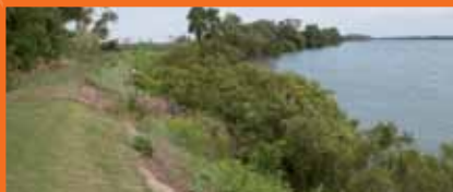
☞ Digue de Salin-de-Giraud