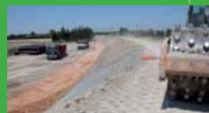
Digue Nord d'Arles