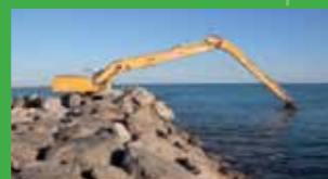
Épi des Arènes