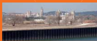
☞ SIP de Beaucaire