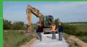
Travaux de Carrossabilité

Le programme dit « des invariants littoral » commencé en 2002 s'est achevé en 2012 pour 12 millions d'euros. Les épis et brise-lames construits permettent de freiner l'érosion marine.